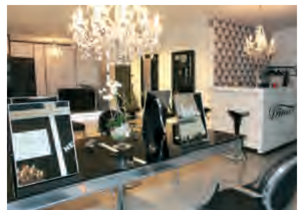
Die Bedienplätze sind mit kleinen Spiegeln bestückt, so wird der Raum nicht unterteilt und wirkt größer.