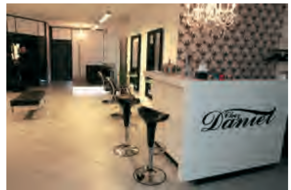
Barockes Ambiente + moderne Details = harmonischer Gesamteindruck: 'Chez Daniel'.