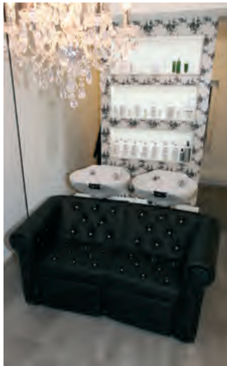
Ebenfalls im barocken Design – die beiden Waschplätze und das Regal mit Pflegeprodukten von La Biosthetique.