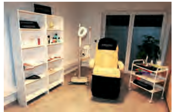
Hier können die Kunden Kosmetikbehandlungen oder ein Tages- oder Abend-Make-up bekommen.