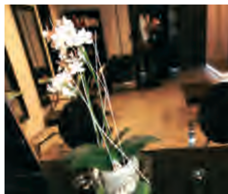
Liebevoll sind Accessoires ausgesucht worden, die harmonisch ins Gesamtbild passen.